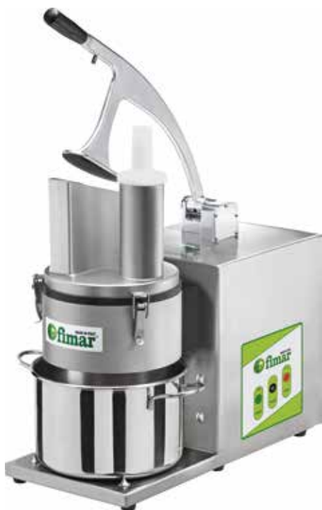
TV4000 - "L'ORTOLANA"