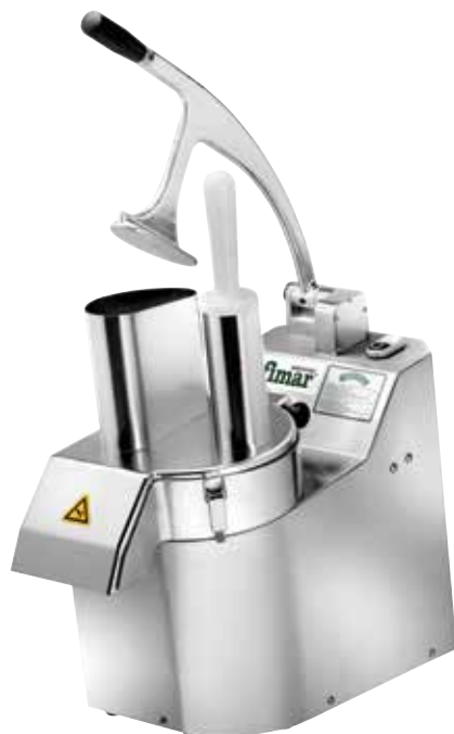
TV2000RN - "LA ROMAGNOLA"