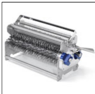
Gruppo lame inteneritrice