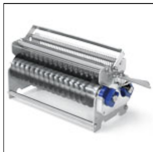
Gruppo lame taglio