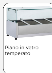
Piano in vetro temperato